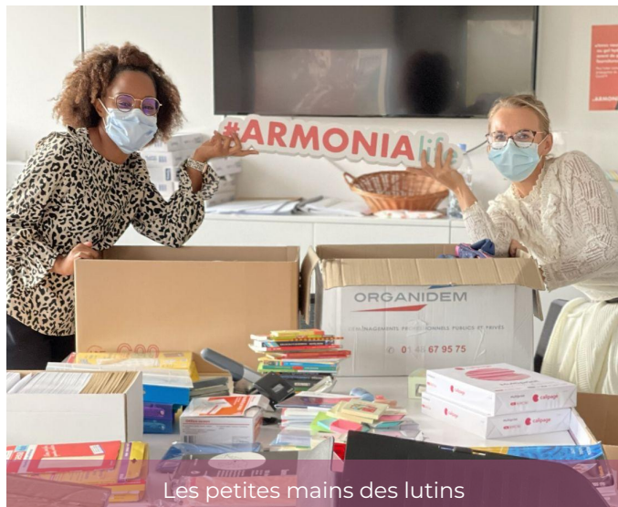
Les petites mains des lutins

Conscients de l'impact social et environnemental de nos achats, nous avons pris la décision cette année de rédiger une charte d'Achats Responsables, au niveau de notre Groupe Armonia et dont bénéficient toutes ses filiales, Phone Régie incluse.