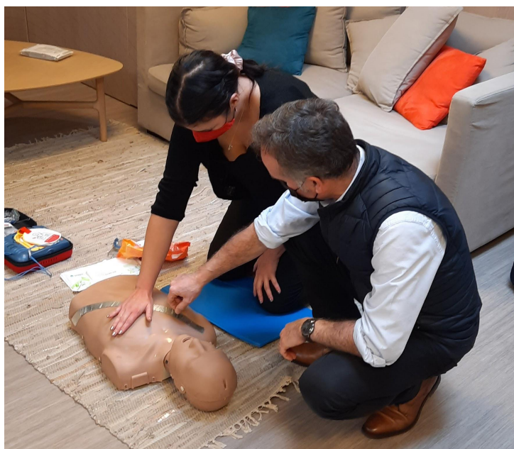
Formation Global Heart Watch - Paris 2022

Tout au long de la Semaine de la Qualité de Vie et des Conditions de Travail, nous avons partagé avec l'ensemble des collaborateurs des guides et conseils autour de différentes thématiques : Guide Gestes & Postures, Droit à la déconnexion, Guide du télétravailleur ou encore Guide de la parentalité.