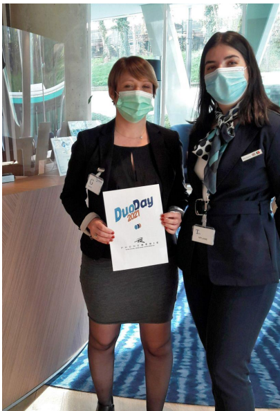
Duo day - 2021

En Mai 2022, ce sont 8 de nos collaboratrices de l'Agence de Paris qui se sont engagées dans la 9ème édition de la Course Solidaire Interentreprises de Boulogne-Billancourt organisée par le Special Olympics France. L'objectif de cette course ? "Changer le regard porté par la société sur le handicap mental".